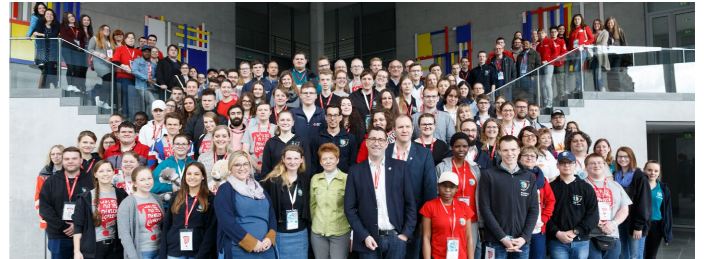
↑ Die JRK-Jugendkonferenz 2019 zu Gast im Bundestag in Berlin.