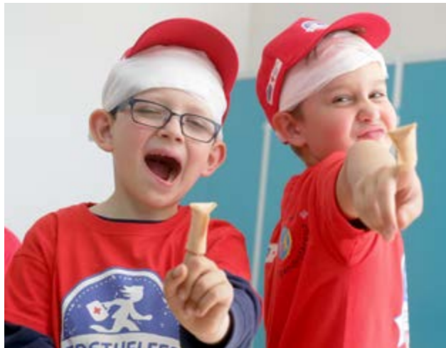
Initiative Erste Hilfe auf den Bildungsplan, Projekttag 2016

Formale Bildung beschreibt das staatliche Bildungssystem von der Grundschule bis zur Universität. Formale Bildung wird häufig auch als schulische Bildung bezeichnet.