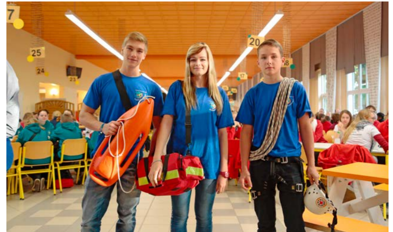
37. JRK-Bundeswettbewerb, Stufe II in Strausberg/ b. Sondershausen, 2014.