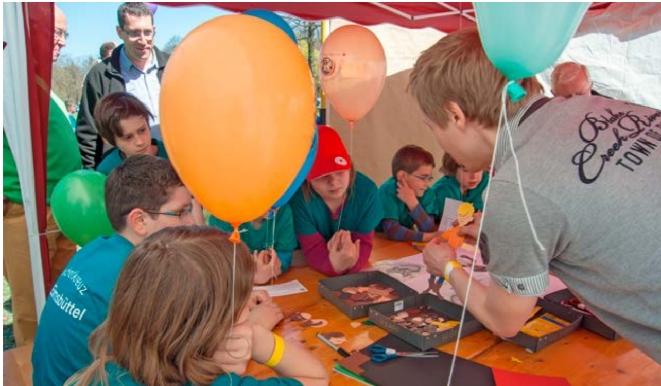
Beim JRK-Kidstag in Hamburg im Rahmen der 150 Jahre DRK-Jubiläumsaktionen 2013.