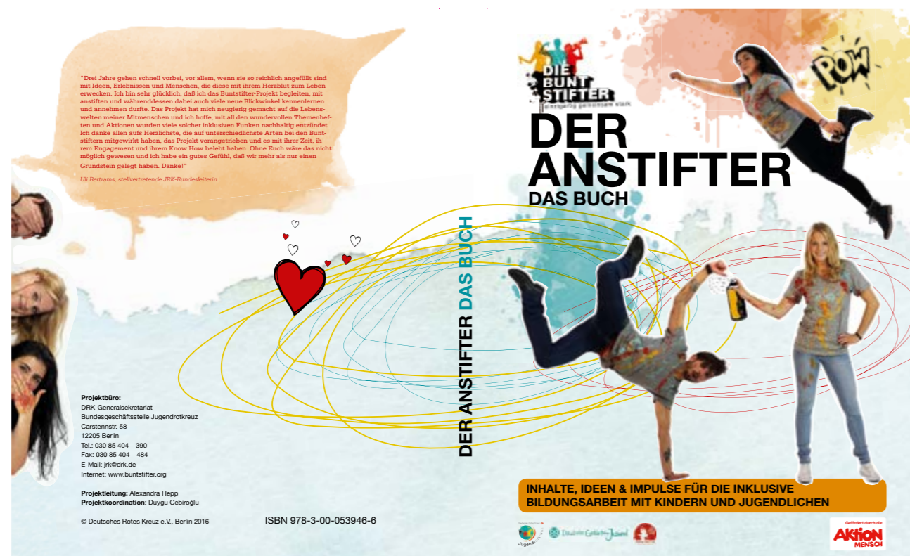
Handbuch des JRK-Projekts „Die Buntstifter“